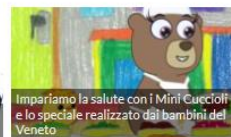
Impariamo la salute con i Mini Cuccioli e lo speciale realizzato dai bambini del Veneto