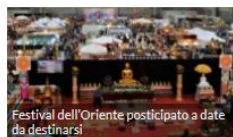
Festival dell'Oriente posticipato a date da destinarsi