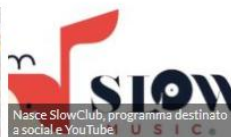
Nasce SlowClub, programma destinato a social e YouTube